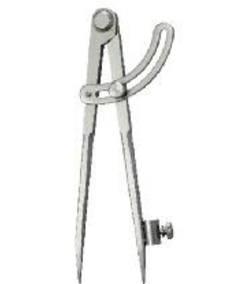
andere Größen auf Anfrage other measurements upon request